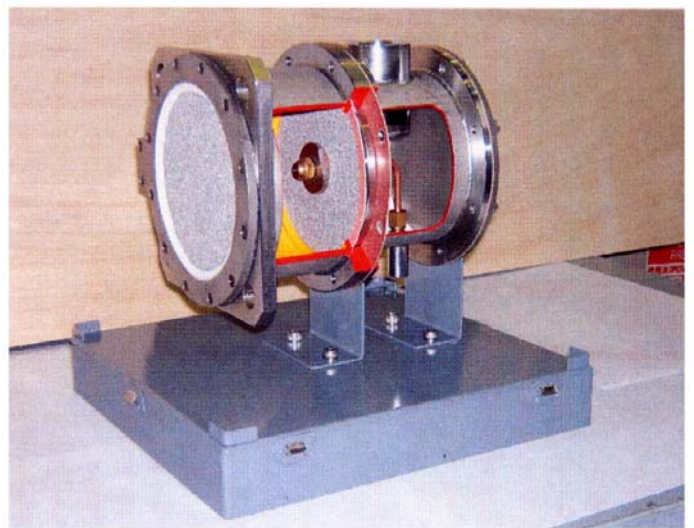
気泡分散バーナカットモデル