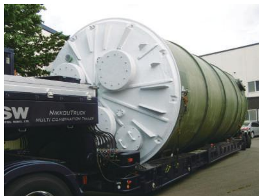
▲100㎡タンク φ3800×10000H 特殊車両による輸送