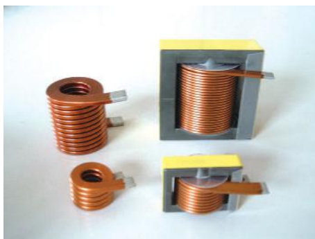
▲エッジワイズ巻き及び完成品 (パワーインダクター)