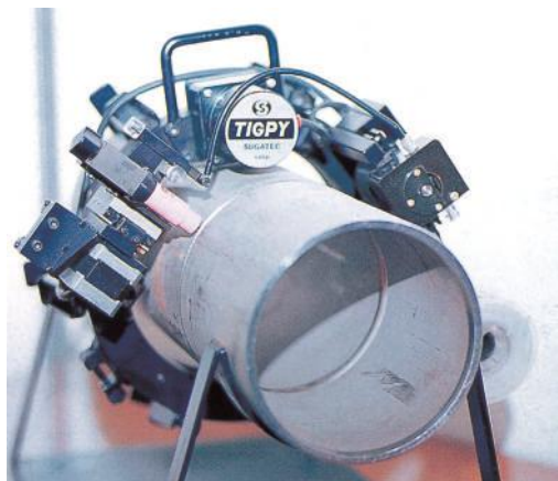
▲パイプ円周自動溶接装置

当社は、豊富な経験と永年に渡って培ってきた技術を駆使し、高品質で経済性、環境に配慮した各種プラント設備の設計、製作、建設、整備をお客様へ提供しております。今後もあらゆる困難を工法開発や改善、新技術への挑戦で乗り越え、総合エンジニアリング会社として、社会に貢献できるよう努力してまいります。