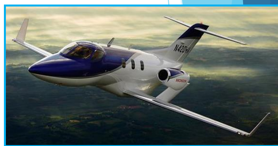
図3 最新の航空機の例 Honda Jet