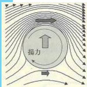
図1 回転円筒によって発生する揚力

講演内容：野球のカーブボールはなぜ曲がるか、飛行機の翼はなぜ揚力を発生させるか、について流れ学（流体力学）の初歩から説明します。次に、飛行体の空気抵抗の発生メカニズムについて説明します。最後に、飛行機や宇宙ロケットが飛行するためのジェット推進の原理と、最新のテクノロジーについて触れます。