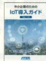
【副読本】 中小企業のためのIoT導入ガイド

NTT・NTTデータ(東京)で、銀行システムや航空管制システムの企画・設計・開発、データ通信システムの品質監理業務、ITコンサルティング業務に従事。1988年に札幌にUターンし専門学校でIT技術者の育成に携わったのち、「ITを経営の力にする」「会社を強くする(強靱化支援)」など企業等の経営支援に携わる。現在は、札幌学院大学の客員教授として、経営学部学生に「ITコーディネータ論」を教えるほか、北海道ITコーディネータ協議会の相談役、戦略経営ネットワーク協同組合の代表理事として、企業・団体・自治体などにIT(IoT、AI、FinTechなど)の利活用や情報セキュリティ、事業継続計画(BCP)などの講演・研修・コンサルティング活動をおこなう。