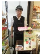
有楽町どさんこプラザでマーケティング調査