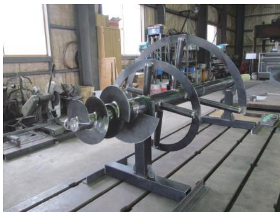
ミキシングスクリーシャフト

当社は精密製缶加工を主力事業としており、紙の汚れや破れを検査する検紙装置などの産業機械やスクリーコンベアに用いられるスクリーの製作などを手掛けています。スクリーについては平成12年から本格的に製作を開始しており、製作には高い技術力が必要となることから道内では競合他社は少なく、売上金額の20%を占める当社の主力事業となっています。