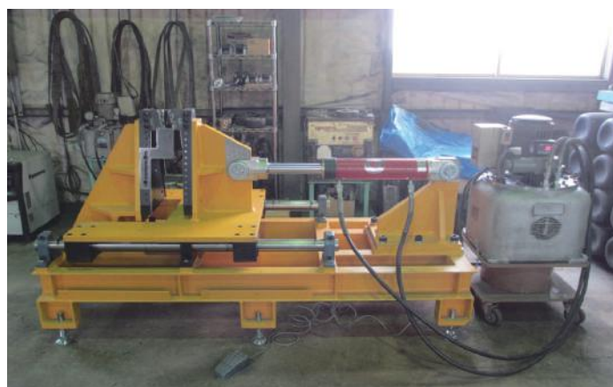
スクリー羽根フォーミングマシンと加工イメージ