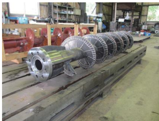
スクリーコンベア（硬化肉盛仕様）