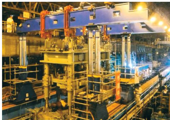
▲自社設計 パイプ矯正機